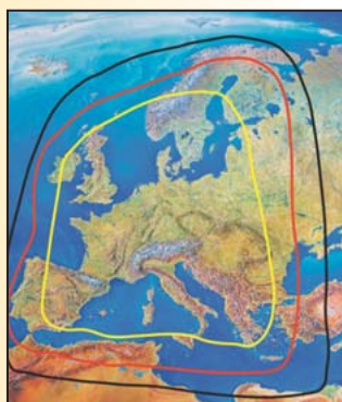
Ontvangstbereik van Hot Bird (13° Oost)