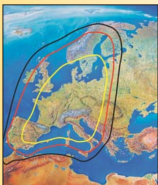
Ontvangstbereik van Astra 1 (19.2 Oost)